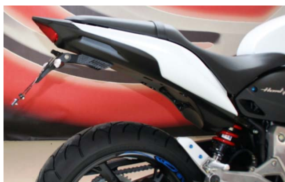
EVOTECH TAIL TIDY

Attenzione: Prima di procedere alla seguente descrizione di montaggio, Evotech specifica che declina all'utente le responsabilità dovute ad un non corretto montaggio dei prodotti e al loro utilizzo improprio. E' consigliato il montaggio del nostro kit da parte di personale specializzato. Le immagini si riferiscono al modello Hornet 2011.